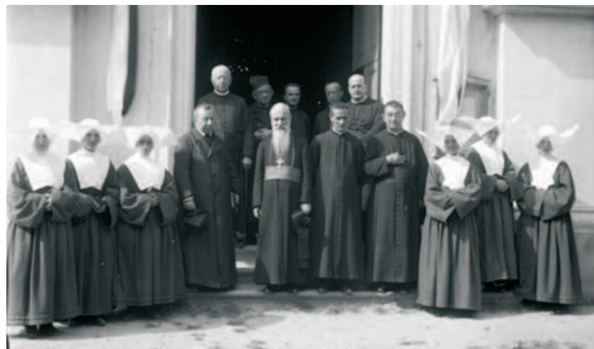
Gruppo di preti e suore davanti a una chiesa.