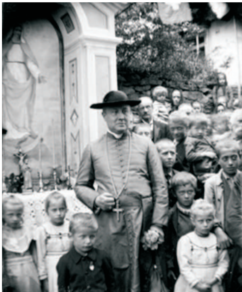
Visita di Monsignor Peri-Morosini.

1 Il giorno della Madonna d'agosto del 1932 l'Amelia si avvia di buonora verso Corzoneso, nel suo grembiule di cotonina. Ha appuntamento con la Rachele alla seconda cappella, quella delle Scale. Vanno su dal Rubertún. Arrivata alla prima cappella, si segna e tira il fiato. C'è profumo di fieno in giro stamattina, lo sente. Di solito non ci fa caso; una come lei, che la prima vacca l'ha munta a undici anni tra lacrime e sudore seduta a fatica sullo sgabello con un secchio attaccato al collo, non ha buon tempo per i profumi. Guarda l'immagine della Vergine in trono, sulle ginocchia il bambino che mostra un cartello. Cosa c'è scritto? L'Amelia non ha mai decifrato quegli strani caratteri. Ora ha gli occhi freschi, è leggera come l'aria della domenica. Ha lasciato casa sua a Torre, dall'altra parte della valle. D'inverno lavora in fabbrica, d'estate in campagna: ma stamattina non ha voglia di portar fieno, basta, vuole andare con la Rachele a prendere le fotografie da quell'uomo su là. La mamma ha alzato la voce, da quando vai in fabbrica non sei più la stessa, «qua tu ghè int in quéla crapa?» Ma lei ha alzato le spalle e se n'è andata.