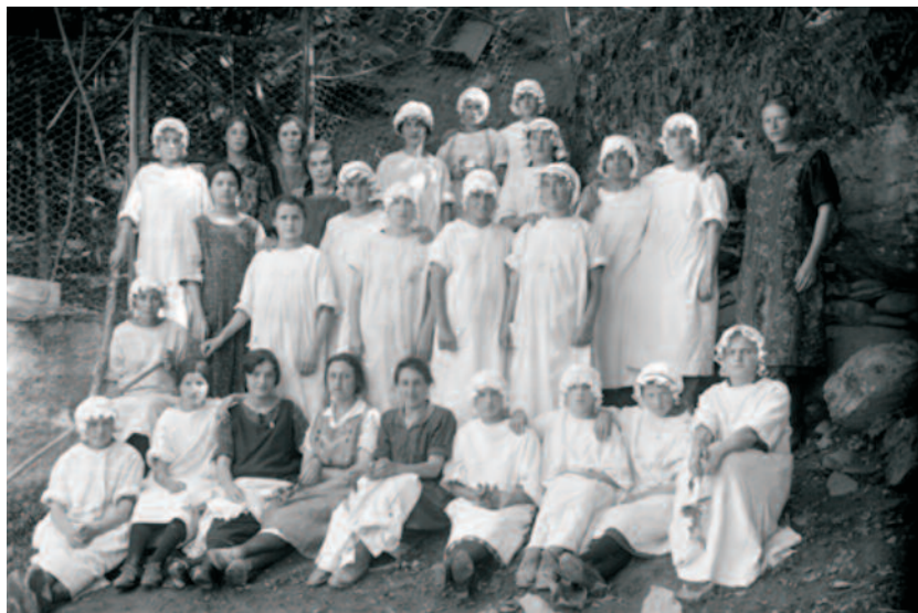
Ritratto di un gruppo di donne del pensionato della Cima Norma